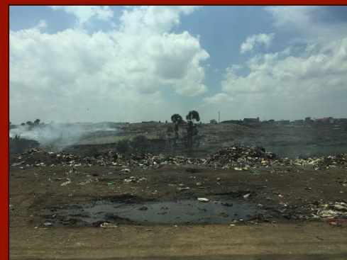
孩子们嬉戏和搜捡旧物的垃圾场